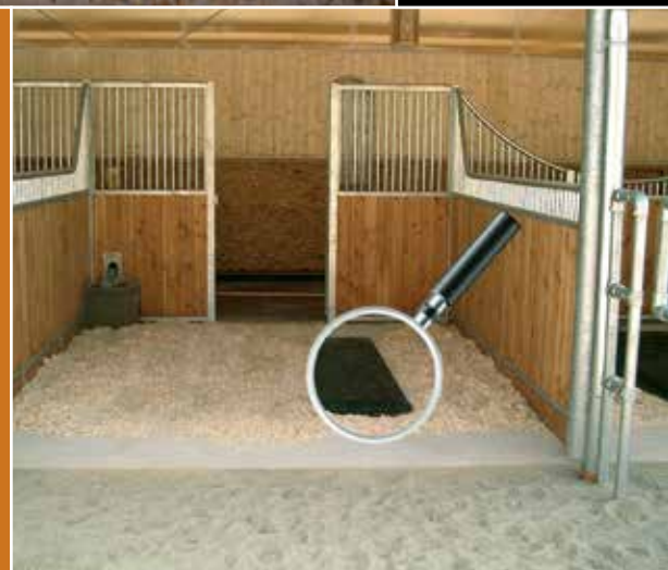
Die Kuschelmatte muss vollständig mit Einstreu bedeckt werden.

Kuschelmatten eignen sich nicht nur für die Freizeitpferdehaltung , sondern bieten auch für Hochleistungssportpferde überzeugende Vorteile. Die Kuschelmatte besitzt eine rutschhemmende Oberfläche sowie innerhalb der Gummiummantelung einen extra weichen Schaumstoffkern. Aufgrund dieser speziellen Beschaffenheit hat das Pferd einen äusserst rutschfesten Untergrund, der gleichzeitig eine sehr gelenkschonende Wirkung hat. Die Verletzungsgefahr wird dadurch stark reduziert und die Muskelregeneration gefördert. Durch die hervorragende Isolation ist das Pferd zudem ausgezeichnet vor Kälte geschützt. Viele Reitsportler setzen deshalb auf unsere Kuschelmatte . Zu unseren Referenzen zählt unter vielen Topreitern auch Pius Schwizer . In den internationalen Deckstationen erfreut sich die Kuschelmatte ebenfalls grosser Beliebtheit. So wird sie beispielsweise vom Gestüt Sprehe schon seit Jahren erfolgreich eingesetzt. Dank des geringeren Zeitaufwands beim Ausmisten bleibt mehr Zeit für Sie und Ihr Pferd.