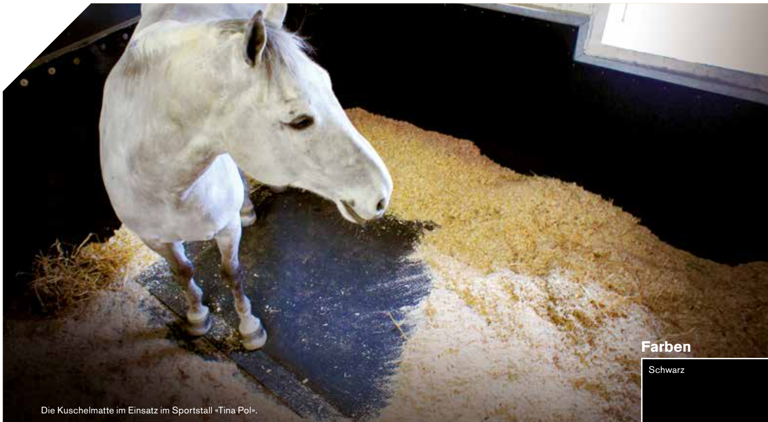
Die Kuschelmatte im Einsatz im Sportstall «Tina Pol».